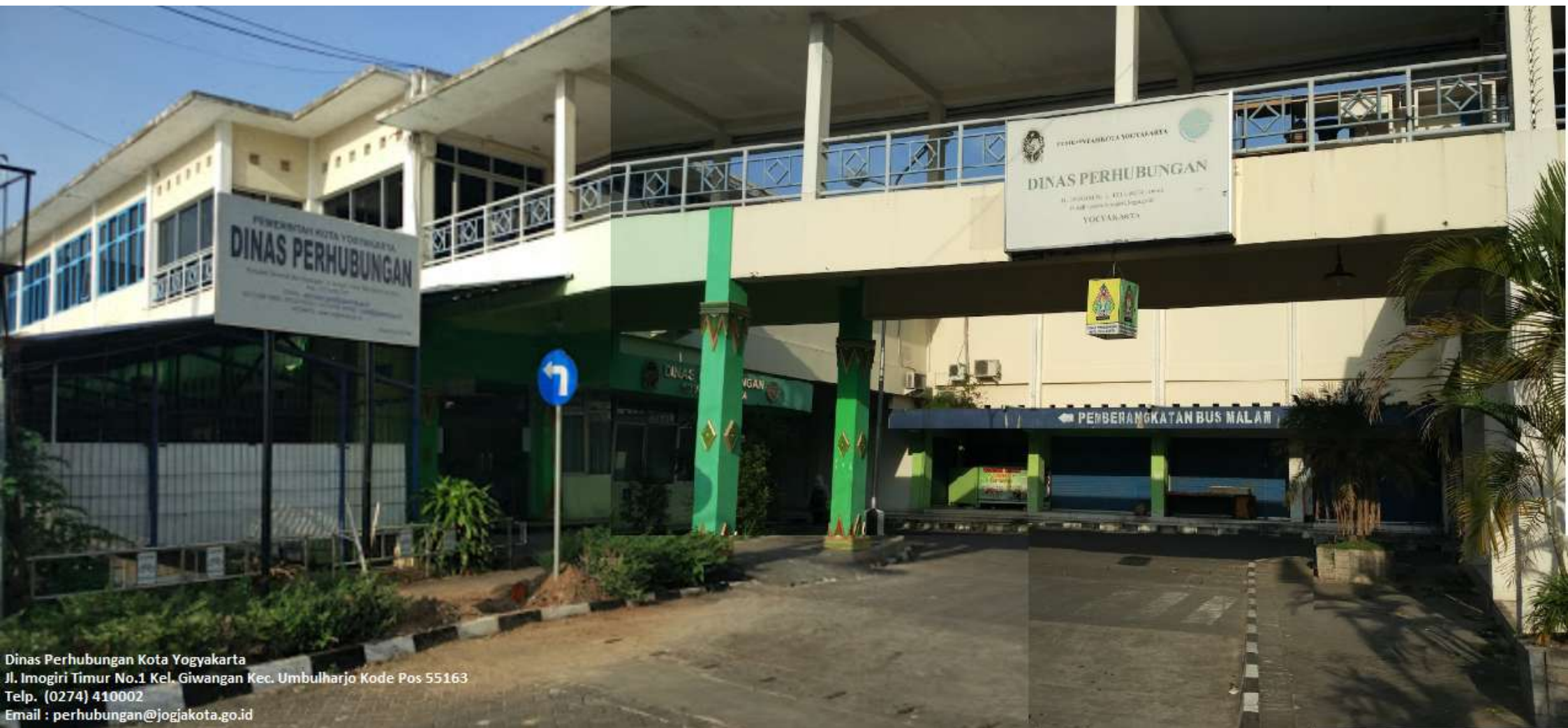
Dinas Perhubungan Kota Yogyakarta Jl. Imogiri Timur No.1 Kel. Giwangan Kec. Umbulharjo Kode Pos 55163 Telp. (0274) 410002 Email : perhubungan@jogjakota.go.id